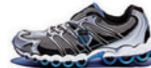
Silver / Black / Brilliant Blue シルバー / ブラック / ブリリアントブルー