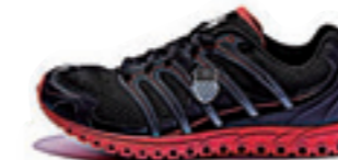
Black / Charcoal / True Red ブラック / チャコール / トゥルーレッド