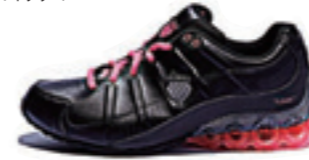
Black / Neopink / Silver ブラック / ネオピンク / シルバー