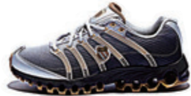
Black Fade / Gold ブラックフェイド / ゴールド