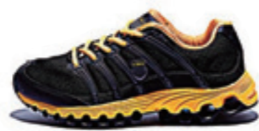
Black / Charcoal / Athletic Gold ブラック / チャコール / アスレチックゴールド