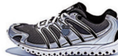
Charcoal / Silver / Black チャコール / シルバー / ブラック