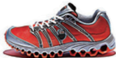
Sunset/Bright Yellow サンセット / ブライトイエロー