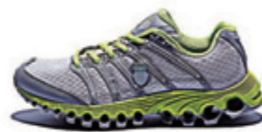
Gull gray / Stingray / Bright Green ガルグレー / スティングレー / ブライトグリーン