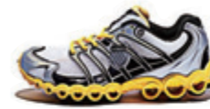
White / Black / Bright Yellow ホワイト / ブラック / ブライトイエロー

踵部に配置された9つの大型チューブとサーマルポリウレタンのシャンクが衝撃から足をプロテクト クッション性が抜群の SUPERFOAM® のトップレイヤーと EVA ミッドソールの組み合わせが、快適な走行性を約束