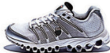
White / Silver / Black ホワイト / シルバー / ブラック