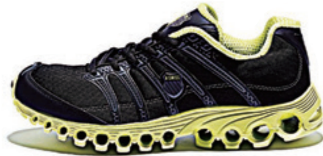
Black / Charcoal / Yellow Optic ブラック / チャコール / オプティクイエロー