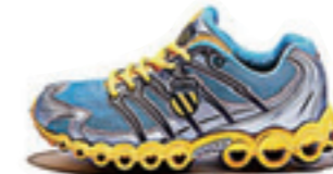
Neon Blue / Silver / Bright Yellow ネオンブルー / シルバー / ブライトイエロー