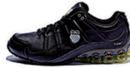
Black / Silver / Brilliant Green ブラック / シルバー / ブリリアントグリーン