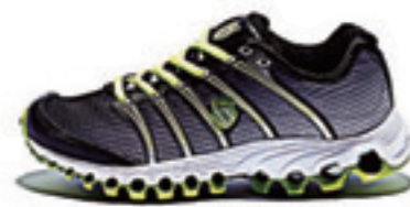
Black Fade / Bright Green ブラックフェイド / ブライトグリーン