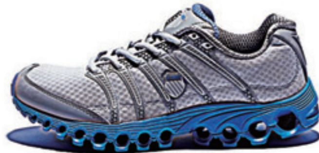
Gull gray / Stingray / Brilliant Blue ガルグレー / スティングレー / ブリリアントブルー