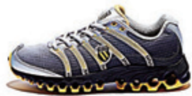
Black Fade / Bright Yellow ブラックフェイド / ブライトイエロー