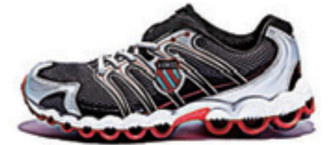
Black / Silver / True Red ブラック / シルバー / トゥルーレッド