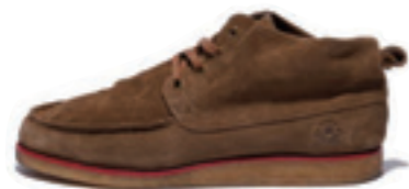
BLUFF MID CS color: sand