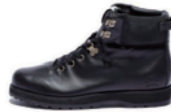
SUMMIT FDT color: brack