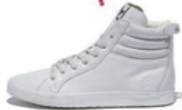
VALLEY FDT color: white