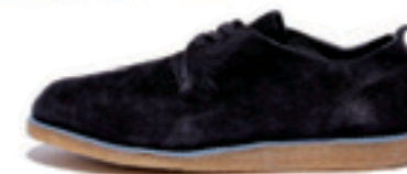
PLAIN color: black

STUSSY(スチューシー)と全型から開発し2011年3月に発売され有名になったモデル。新しく登場したニューシルエットのPlain(プレーン)は、秋らしいスエードのモデル。ウォータープルーフのスエードアッパー、カーフスキンのライニング、ソフトなクレープソールで履き心地も追求されている。