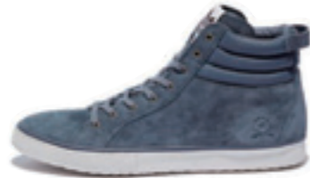
VALLEY FDT color: light gray

タイムレスなデザインのVALLEY FDT(ハリー)が再登場。ヌバックレザーと艶のあるグロスレザーの2バージョンがあり、ともにラムスキンをインソールとライニングに使用している。FDTはFOUNDATIONの略。