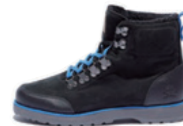
FOUNDATION SUMMIT 2.0 color:black

SUMMIT 2.0(サミット)のモデルをベースに、ブーツに必要なテクニカルな要素を全て盛り込んだモデル。ウイスラー山脈からほど離れた場所の赤い岩盤(=Tantalus)をアッパー全面にプリント。「より暖かくより薄く」がコンセプトのシンサレート(=Thinsulate)のライニングとシープスキンのインソールを使用した、こちらもエレメントコレクションが誇る高機能モデルとなっている。