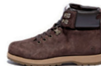
SUMMIT FDT color: brown