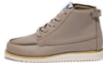
CREEK FDT color: sand

ミッドカットのモックタイプモデル。ラムスキンのライニングとアッパーには厚みのあるフルグレインレザーのシワが独特の風合で味わい深い。