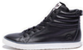
VALLEY FDT color:brack