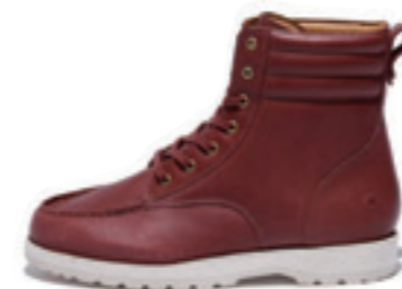
FOREST color: brick