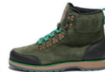
FOUNDATION SUMMIT 2.0 color:olive