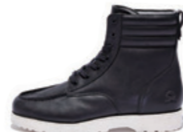
FOREST color: black